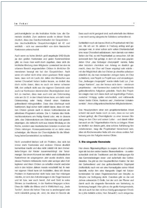
► Abb. 7 Vergleich einer Textseite der Ausgabe 2010 (links) mit einer der Ausgabe 2021 (rechts)