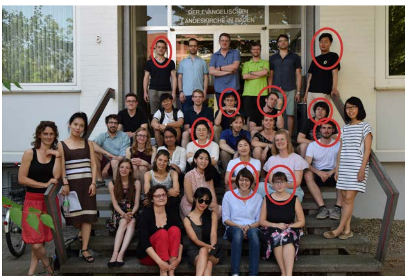
► Abb. 10 Ausgangsfoto mit Personen, die im Nachhinein retuschiert wurden