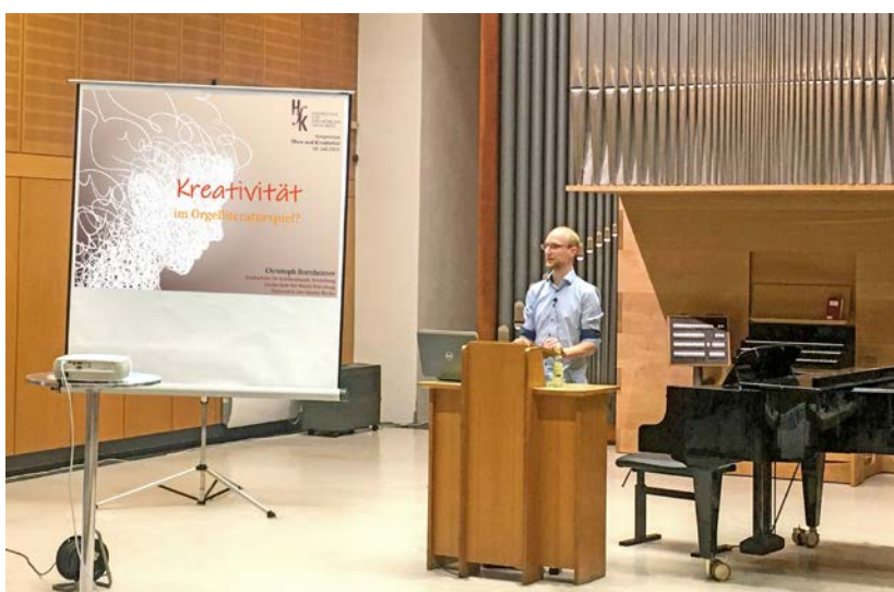
► Abb. 11 Kreativität ist gefragt: Finde die Unterschiede!