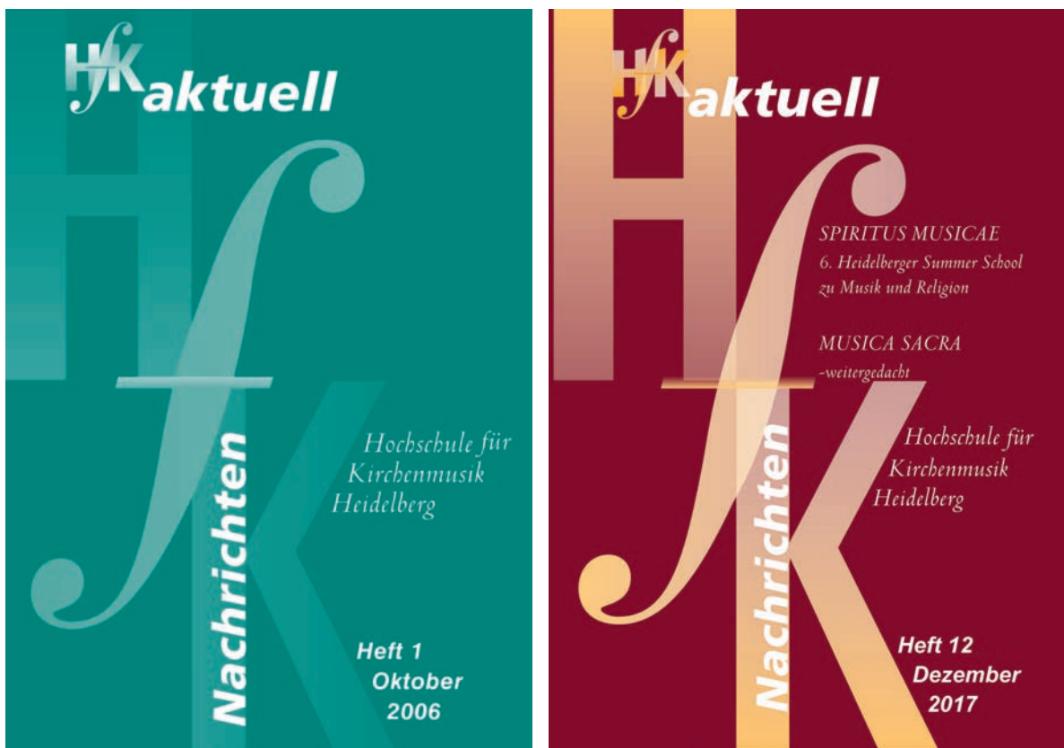
► Abb. 2 Cover der ersten und der letzten Ausgabe vor Relaunch im Vergleich