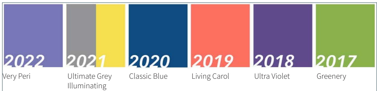
► Abb. 8 Pantone Colors of the Years 2017–2022. Zwei hiervon wurden für die HfK aktuell im entsprechenden Jahr verwendet.