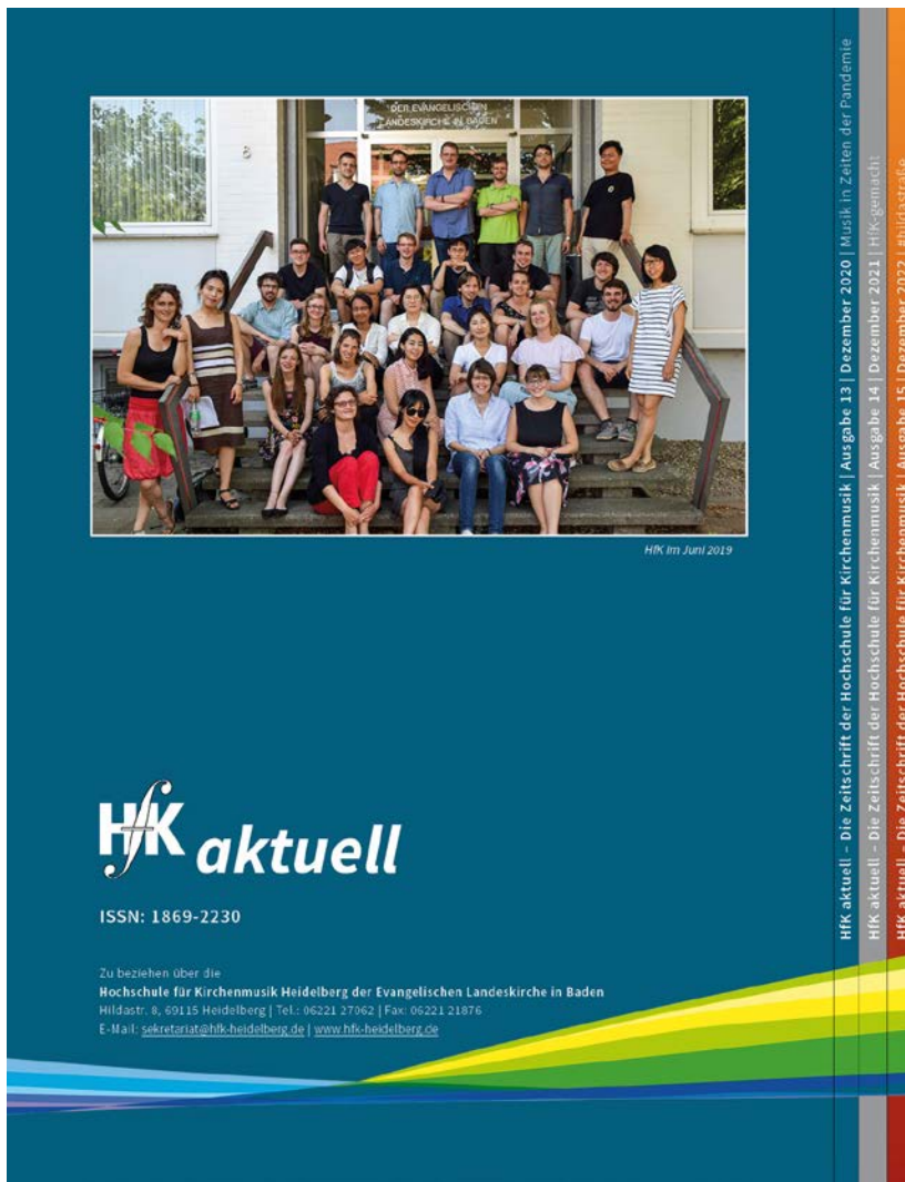
► Abb. 9 Rückseite 2020 mit „Bilderrahmen“ und den folgenden Buchrücken