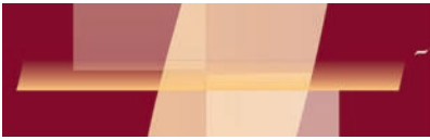
► Abb. 5 2017: Durch die neue Transparenz werden ungenaue Arbeiten sichtbar, die vorher im Hintergrund versteckt waren

Ein Relaunch auf Basis der exzellenten Grundlage war daher an der Zeit.