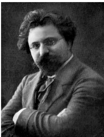
► Abb. 1 Sigfrid Karg-Elert um 1910

Sigfrid Karg-Elert wurde 1877 als Siegfried Theodor Karg in Oberndorf am Neckar geboren. Kurz darauf siedelte die Familie nach Leipzig über, wo er studierte und später als Professor für Musiktheorie und Komposition wirken sollte. Die auffällige Änderung der Schreibweise seines Vornamens und das hinzugefügte „Elert“ ge-