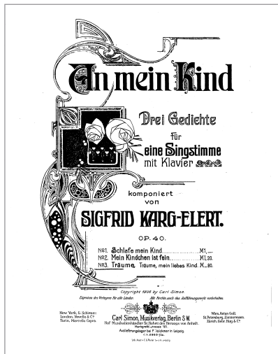
► Abb. 3 Titelseite von Opus 40

Drei Lieder von 1906. Darin finden sich ein Schlaflied, dann das Lied Mein Kindchen ist fein mit ganz lustigem Text: „kam einmal ein reicher Mann. [...] Nein, er kriegt gewiss nicht meins [mein Kind], kauft er sich woanders eins.“ und die bereits genannten Träume (NB 13) mit Text von Karg-Elert selbst.