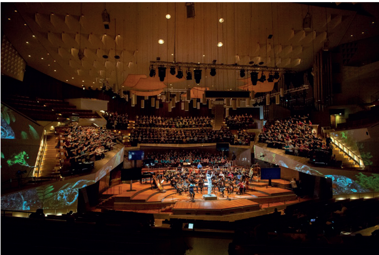
Lichtinstallationen tauchen den großen Saal der Philharmonie schon hier bei der Generalprobe ins rechte Licht